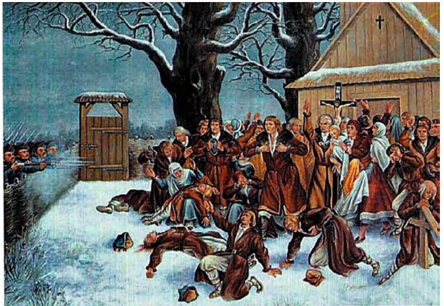
Męczennicy z Pratulina, Walery Eljasz-Radzikowski (1841–1905)